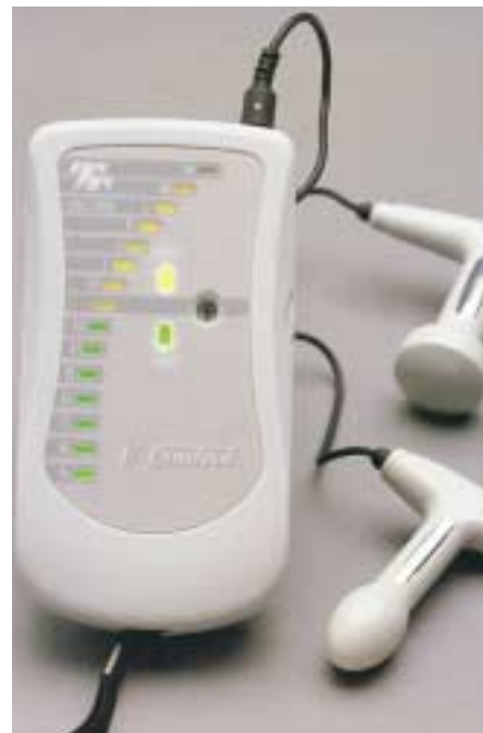
Abb. 3: EMG-Biofeedback-Trainer

auch das Drangsyndrom bzw. die motorische Dranginkontinenz positiv beeinflusst. Wenn die Beckenbodenmuskulatur nicht gespürt und bewusst angesteuert werden kann, ist die Elektrostimulation eine Methode, die Funktion von Muskeln und Nerven zu verbessern oder die Wahrnehmung zu verstärken. Die Verordnung von handlichen