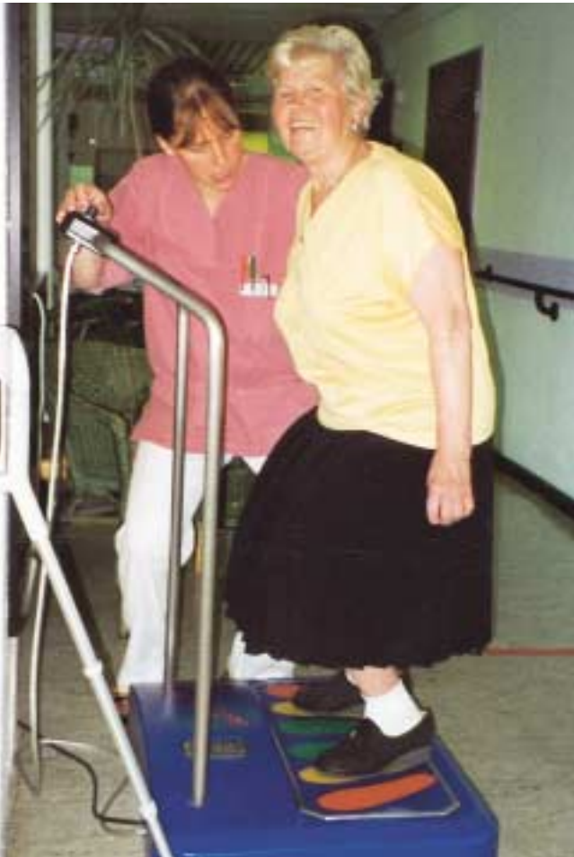
Abb. 4: Reflektorische Muskelstimulation mittels Wippe

der Toilettengänge und Miktionen angestrebt. Dieses Vorgehen ist gerade bei Dranginkontinenz und der im Alter häufigen Detrusorinstabilität angezeigt – auch in Kombination mit einer medikamentösen Behandlung.