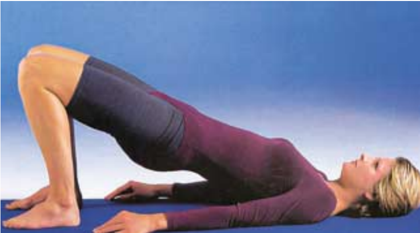
Abb. 2: Übung im Rahmen des Beckenbodentrainings

regelmäßig Beckenbodengymnastik, 25 weitere erhielten zur Muskulaturstärkung Elektrostimulationen, während 27 Patientinnen täglich 20 Minuten lang einen Vaginalkegel trugen. Außerdem gab es 30 Kontrollpersonen ohne Behandlung. Über Erfolg oder Misserfolg der Behandlung entschied der Einlagentest: Hierbei wurde jeweils 200 Milliliter Kochsalzlösung in die entleerte Blase gefüllt. Dann mussten die Probandinnen jeweils 30 Sekunden auf der Stelle laufen und springen. Die wenigste Flüssigkeit ging bei den Frauen verloren, die zuvor regelmäßig Beckenbodentraining absolviert hatten.